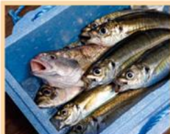
魚臭、生肉、加工品 などの臭い消臭洗浄