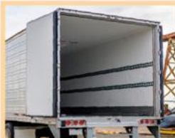
運送業コンテナの 臭い消臭洗浄