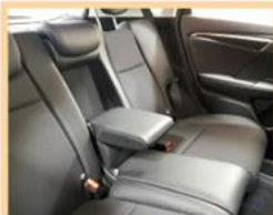
レンタカー、中古車の 消臭洗浄