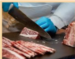
調理場やホールの 臭い消臭洗浄