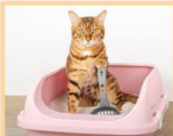
ペット糞尿の消臭洗浄